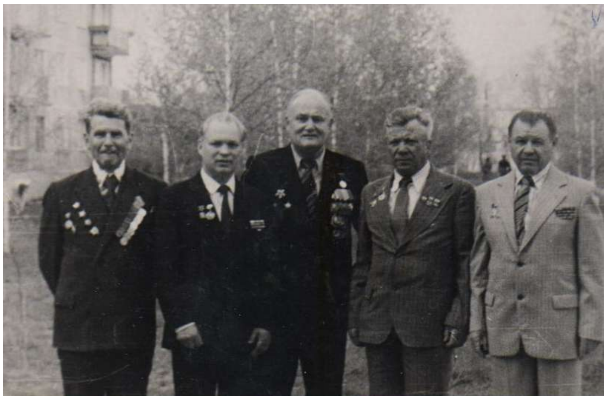
Встреча однополчан, г. Москва, 9 мая 1982 года